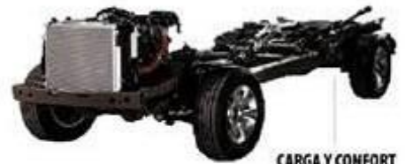
CARGA Y CONFORT