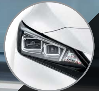
FAROS DELANTEROS LED